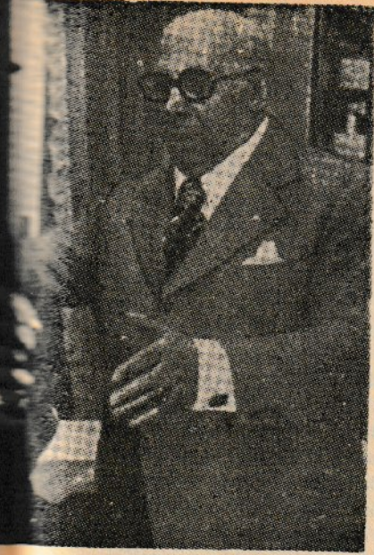
... arasında elerini nasıl kullan- ... storiye.