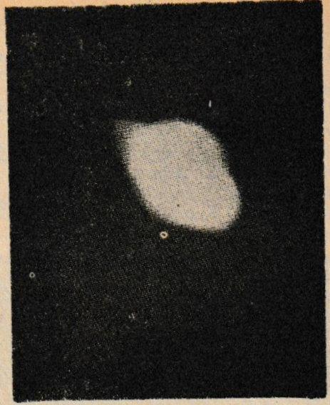
Astronot J. Lovell'in çektiği UFO.

1964 yazında Renger-7 isimli yapma uydu ayın 4320 adet fotoğrafını çekmişti. Bunlardan bazıları daha önceden hiç görülmemiş manzara resimleriydi Renger-8 isimli uydu ise 7.000 resim göndermişti. Bu