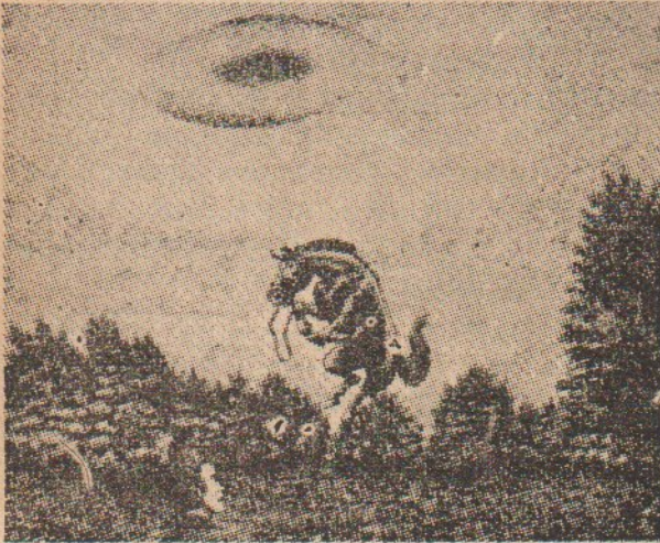
UFO'nun etkisiyle yükselen at.

⊙ Bunlar basına aktarılır ve okuyucular okuduktan sonra gökyüzüyle daha çok ilgilenir olurlar. Bunun ardından bir hatalı gözlem tufanı başlar. Bunların pek çoğu UFO zannedilmiş nadir atmosferik olaylar ve bulut