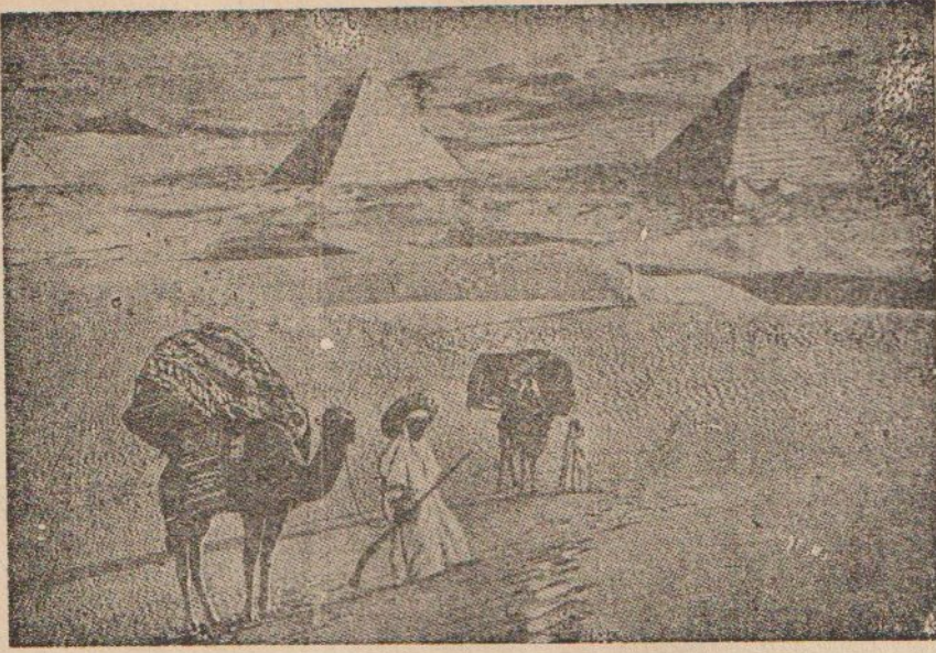
Pramitler: Atlantis biliminin enerji merkezleri

miş olan Atlantis'de de bilimsel ve teknik ilerlemenin ve buna ilâve olarak psişik güçlerin, hayır ve iyilik uğruna değil de, nefsadi amaçlar için kullanılması, Atlantis'in sonunu getirmiştir.