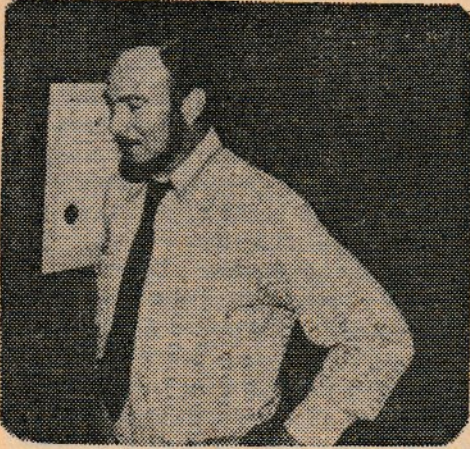
Astronot Edgar MITCHELL

Noetik Bilimler (Şuur Etüdüleri) Enstitüsü California'nın Palo Alto kentinde bulunmakta olup, kâr amacı gütmeyen bir organizasyondur. Enstitünün kurucusu ve başkanı Astronot E. Mitchell'dir. Enstitü, daha önceleri EDMA Corporation tarafından yürütülmekte olan eğitim ve insanlara ve gezegene yardım faaliyetlerini de üstlenmiş bulunmaktadır.