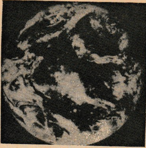
36 bin Km. yüksekten çekilen Dünya fotoğrafı.