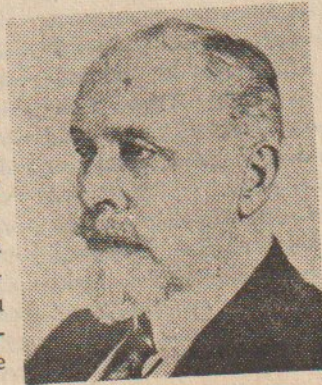
Schrenck - Notzing