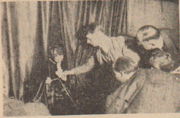
Medyomdan Ektoplazma Çıkışı