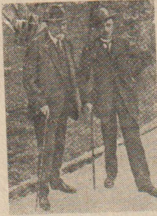
Richet ve Notzing

olarak bir azalma meydana geldiğini tesbit etti. Bu iddia, paranormal fenomenlerin mekanizmaları hakkındaki yeni anlayışlara ters düşüyor görünmektedir. Yüksek bir buutta, zamanımıza bağlı olmayarak gerçekleşen psişik - bioplazmatik operasyonların, bizim evrenimizde başka kuvvet cinslerine (veya enerjilere) dönüşmeleri (örneğin, antigravitativ kuvvetlere; veya elektromanyetik polarizasyonun