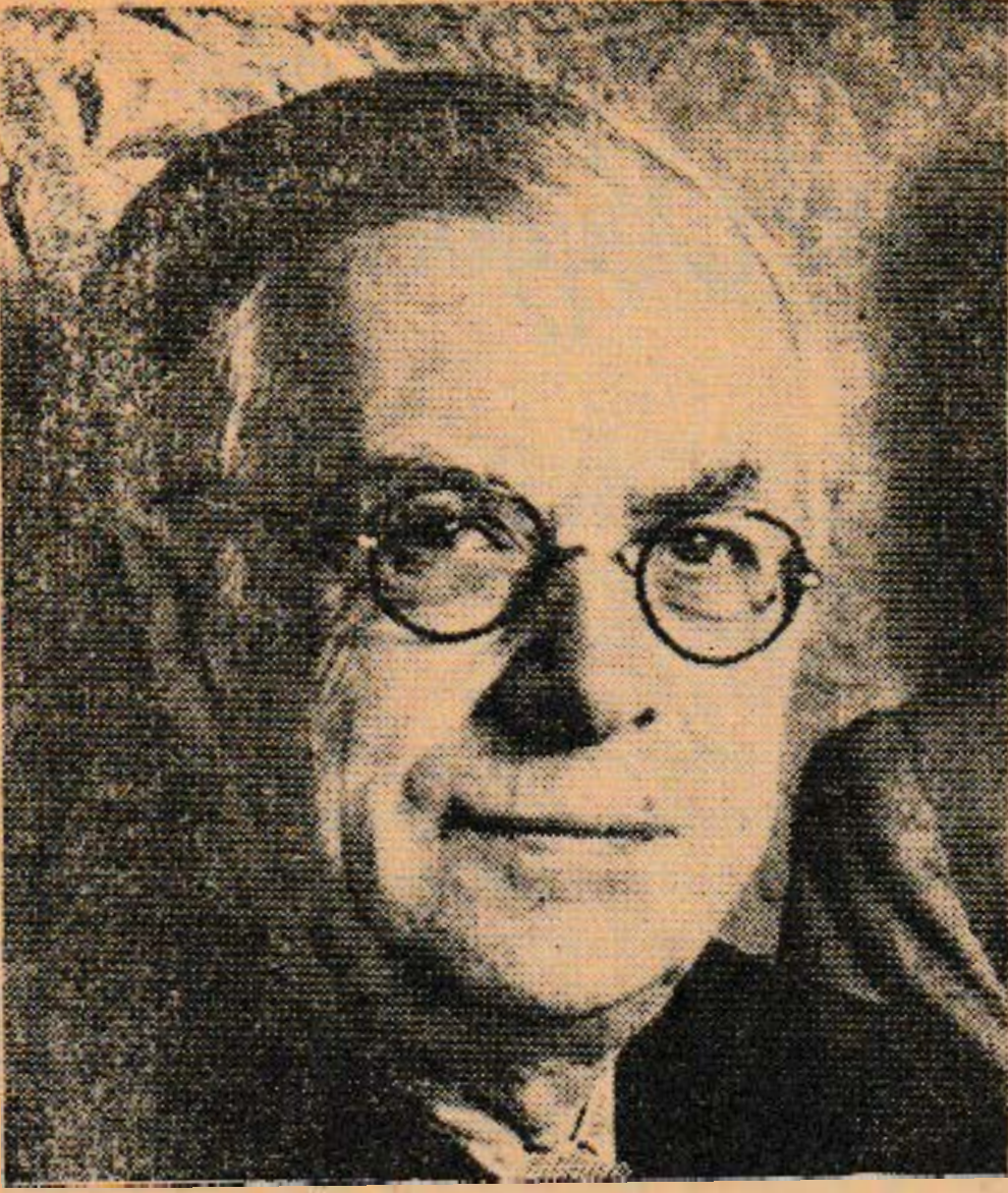
— Julian HUXLEY

Mukaddes kitaplar sahte peygamberlerden bahsederler. Her devir kendi buluşlarının sevinci içinde son sözü söylemekte olduğunu sanmaya temayül duymuştur. Bu gün ise insanlık yeni bir bekleyişin heyecanını duymaktadır. Ne söyleyeceğimizi bilemiyoruz. Fakat bir şeyler beklediğimiz muhakkak.