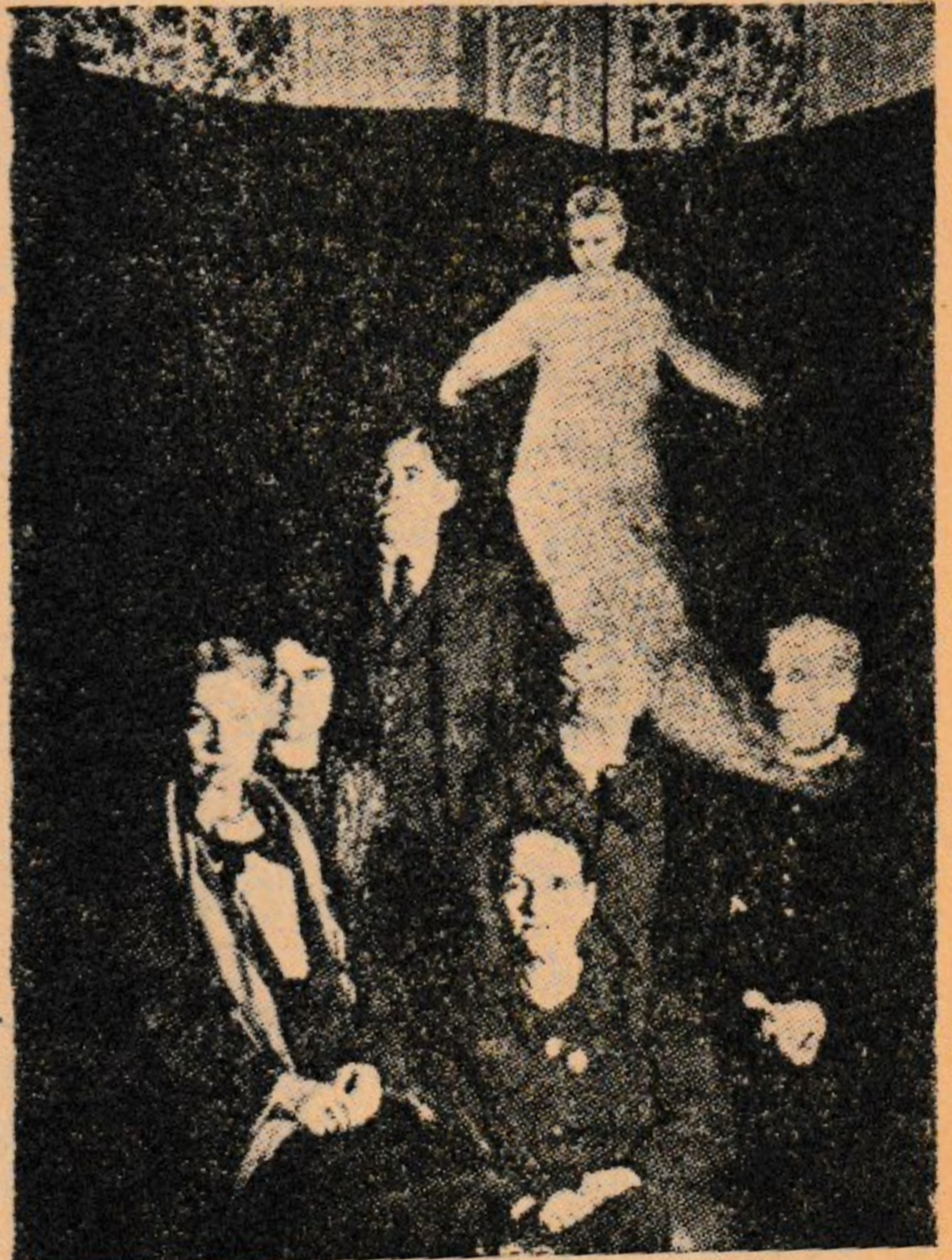
Müteal bir fotoğraf örneği.