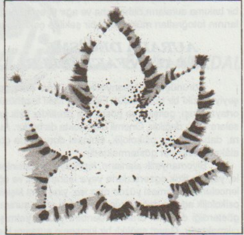
Bir yapraktan yayılan enerjinin Kirlian yöntemiyle çekilen fotoğrafı

Şuur alanlarının girişimi çok önemli bir konudur. Bir toplumun, ahenkli bir toplum olmasını sağlayan asıl çekirdek, şuur alanları arasındaki girişimin uyum yüzdesidir. O toplumu meydana getiren varlık-