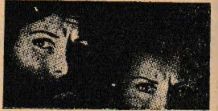
Bakışlarımız, aynı anda karyolanın üzerinde birleşti: Dehşetle ürperdik!..

Bu garip, düşündürücü olayı çözebilmek, bu konuda herhangi bir açıklama yapabilmek, ancak, hâdiseyi spiritüalizm açısından değerlendirmekle mümkündü: Kaybettiklerimizin, devamlı surette bizlerle ilgilendikleri, bizlerle temas halinde buldukları ise, bu büyük gerçeklerden biriydi sâdece!..»