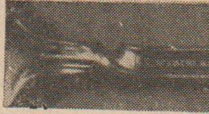
Kaşık sapının bu şekilde bükülebilmesi hiç bir mekanik sistemle açıklanamaz.