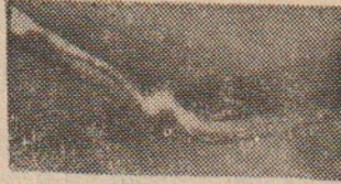
Kaşık sapı paranormal bir güçle, telekinetik etkiyle bükülmüştür.

alandaki çalışan ve bu yetenekleri insanlara tanıtan bir araştırmacı bilim adamı olmasını isterim» demiştir. Masuaki