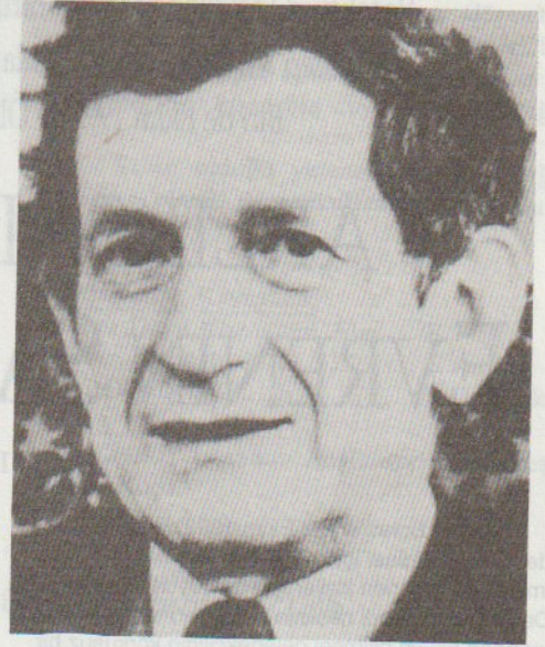
DAVID BOHM (1917 - 1992)

Kuantum potansiyeli tüm uzayı kaplar ve kuantum sistemleri arasında doğrudan bağlantı sağlar. 1959'da Bohm ve genç bir araştırma öğrencisi olan Yakir Aharonov, kuantum bağlılığına