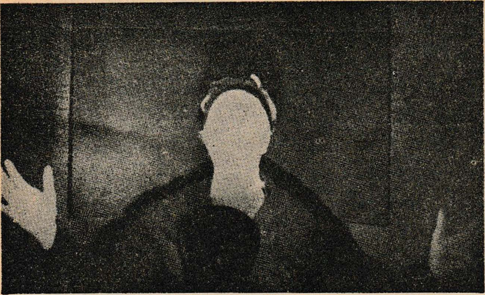
Medycmun yüzündeki ve bir elindeki ışıktaki meydana gelmiş olan değişikliği fotoğraf tekniği ile açıklamak imkânsızdır.