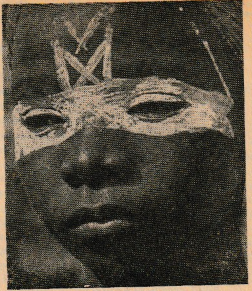
Bir zenci inisiyenin maskesi

Neticede geleneksel medeniyetlerin ancak, görünmeyen, bununla beraber gerçek, reel bir başka plânın mevcudiyeti ile izah edilebileceğini idrak ettim. Bu, kabartma bir modelin bıraktığı oyuk iz kadar hakikî idi.