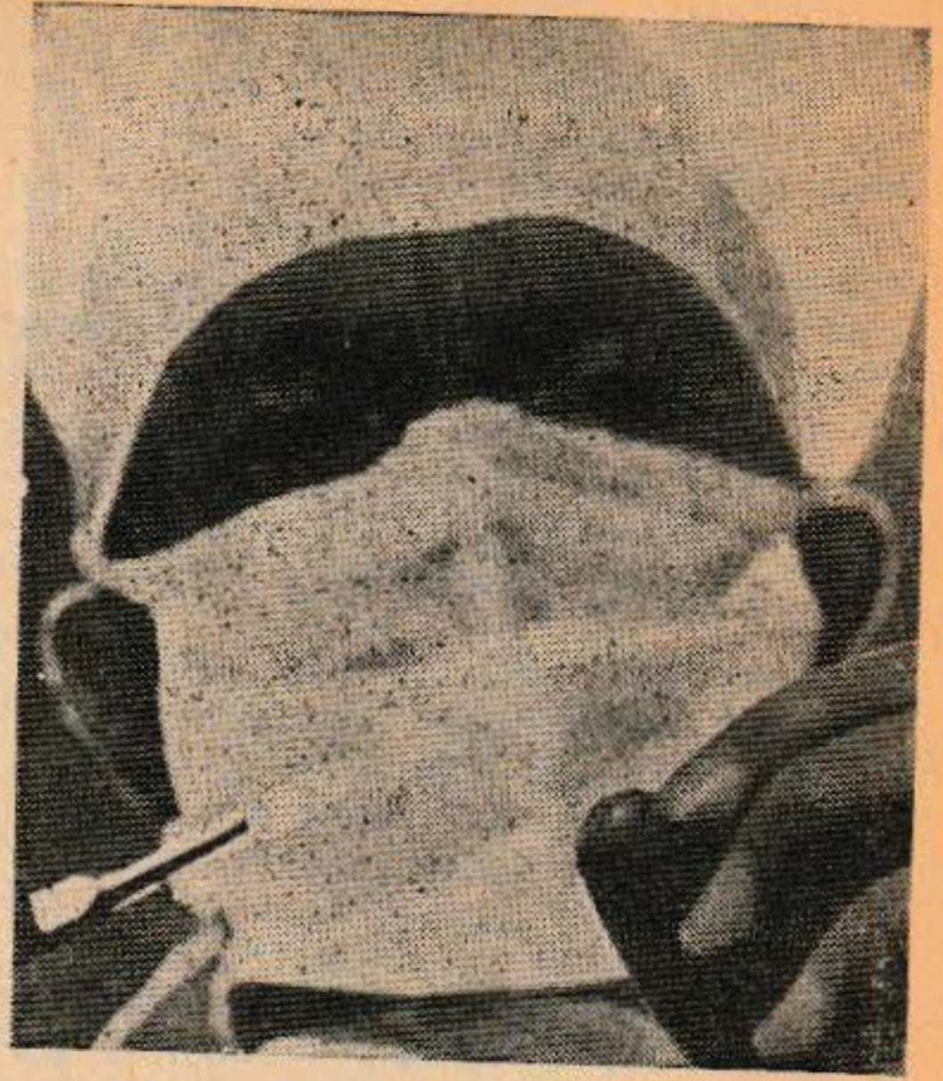
Bir operatörün maskesi

Onsekizinci asrın seyyahları, acele bir hükümle felsefeden bahsetmek için avağa na bir don giymiş olmayı lüzumlu gördülerse, şurasını iyi bilelim ki, uzun zaman