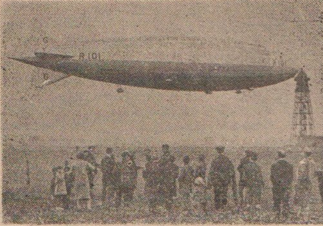
«R-101» 1929'da, Cardington'daki bağlanma iskelesinde.

şüp görüşmemesi konusunda bir türlü karar veremiyordu.